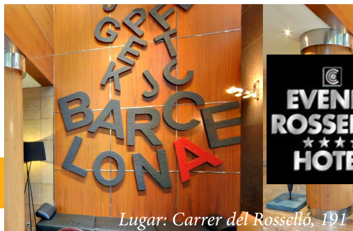
Lugar: Carrer del Rosselló, 191